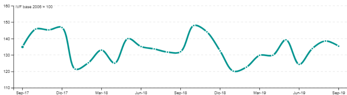
Evolución mensual de Industrias manufactureras sin refinería, período septiembre/2017 - septiembre/2019

Si se analiza únicamente el agregado núcleo duro , setiembre fue un mes de leve crecimiento en la producción respecto a igual mes de 2018, ya que el indicador varió 0,1% interanual. Por su parte, la variación para el último año móvil respecto al año móvil finalizado en setiembre de 2018 se sitúa en -2,8%, menos negativa que la variación para el año móvil finalizado en agosto de 2018.